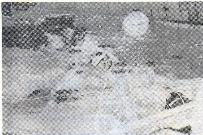
● De herenploeg van WZ & PC staat op het punt te scoren tijdens een van de wedstrijden van het waterpolotoernooi in zwembad De Wilgenhoek.